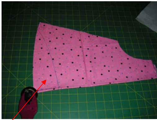
de ovale boog: in maat 86 = 7 cm hoog