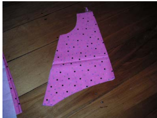
het voorpand zoals het er na het afknippen uit ziet

Teken een halfronde boog op het voorpand van de bovenjurk en knip daarna de stof af. Je kan de boog ook tot aan de rand tekenen, maar in dit voorbeeld gaat de boog tot 4 cm voor de zijkant. Pas de hoogte van de boog aan de maat van de jurk aan.