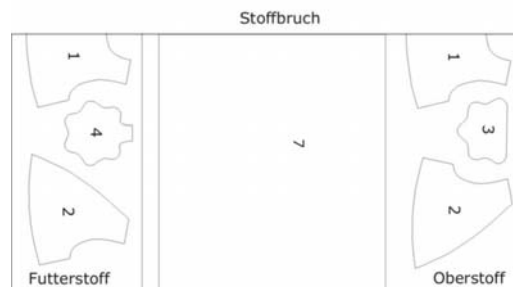
Variante 2 (Jupe à 1 pièce)