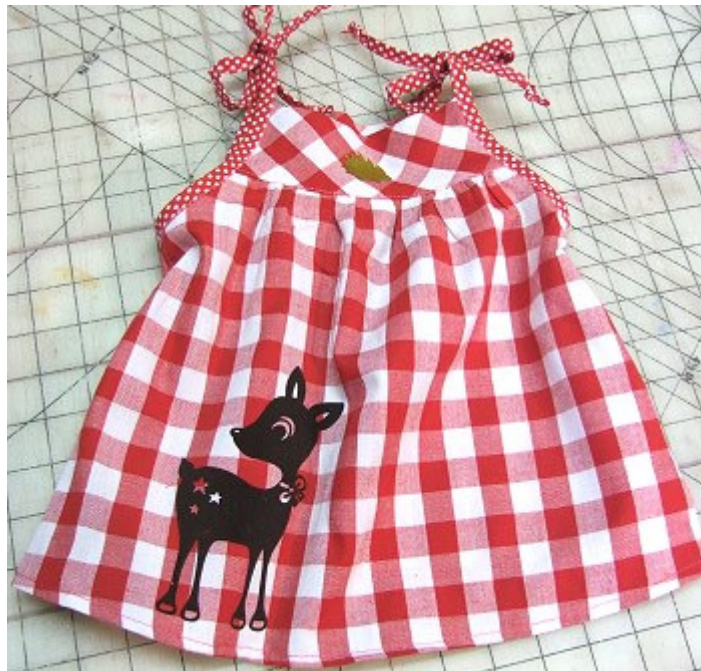
jurk met strikbandjes

maar kruipertjes kunnen beter schouderbandjes dragen.